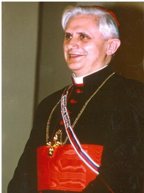
Benedikt XVI., Pont. em. Ehrenmitglied Rupertiae seit 11. Februar 1978